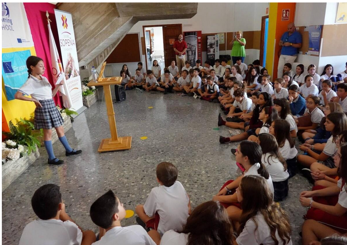
Imagen del Periódico Extremadura con motivo del Día de las Lenguas.