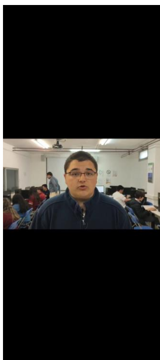
Este alumno, junto con otros más, también embajadores juniors, participaron en la creación de un vídeo de difusión sobre la importancia de la Unión Europea en nuestra vida y qué hace nuestro colegio por la Unión Europea. Una campaña de comunicación llevada a cabo por la Fundación Academia Europea de Yuste y que se lanzó el 9 de Mayo