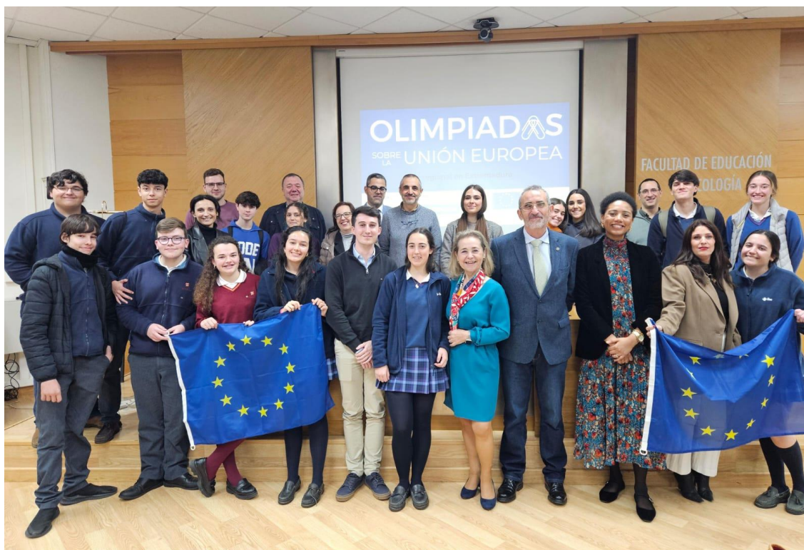
Imagen de embajadores en acto de comunicación de I Olimpiadas Europeas, con Consejera de Educación, Concejala de Juventud y Vicedecano. La foto tuvo repercusión en bastantes medios de comunicación (Juntaex.es, Extremadura.com, Ondacero Sur Extremadura, La gaceta Extremeña de la Educación, anpeextremadura.es)